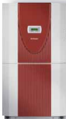
LI 11MER LI 11TER+ LI 16TER+