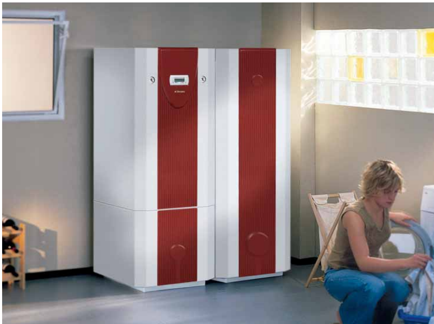
Pompe à chaleur compacte à eau glycolée avec réservoir tampon sous-jacent et ballon d'eau chaude