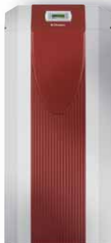
WI 9ME WI 14ME WI 9-27TE

Les composants individuels combinables du circuit de distribution permettent