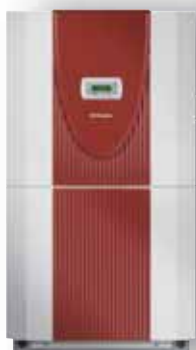
LI 20TE LI 24TE LI 28TE