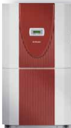
LI 11ME LI 11TE LI 16TE