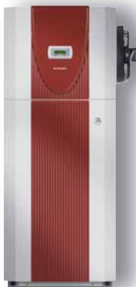
LIK 8ME LIK 8TE LIK 8MER

Pompe à chaleur de chauffage en version compacte. Les composants intégrés du circuit de chauffage non mélangé facilitent l'installation :