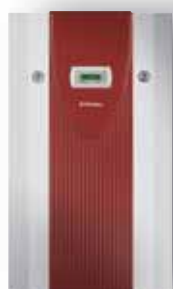
SIK 11ME SIK 16ME SIK 7TE SIK 9TE SIK 11TE SIK 14TE

Pompe à chaleur de chauffage en version compacte. Les composants intégrés du circuit de chauffage non mélangé facilitent l'installation :